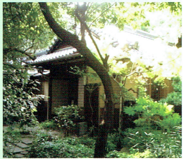
今米の 川中邸茶室

発行所/中鴻池リージョンセンター企画運営委員会 http://www.greenpal-c.com